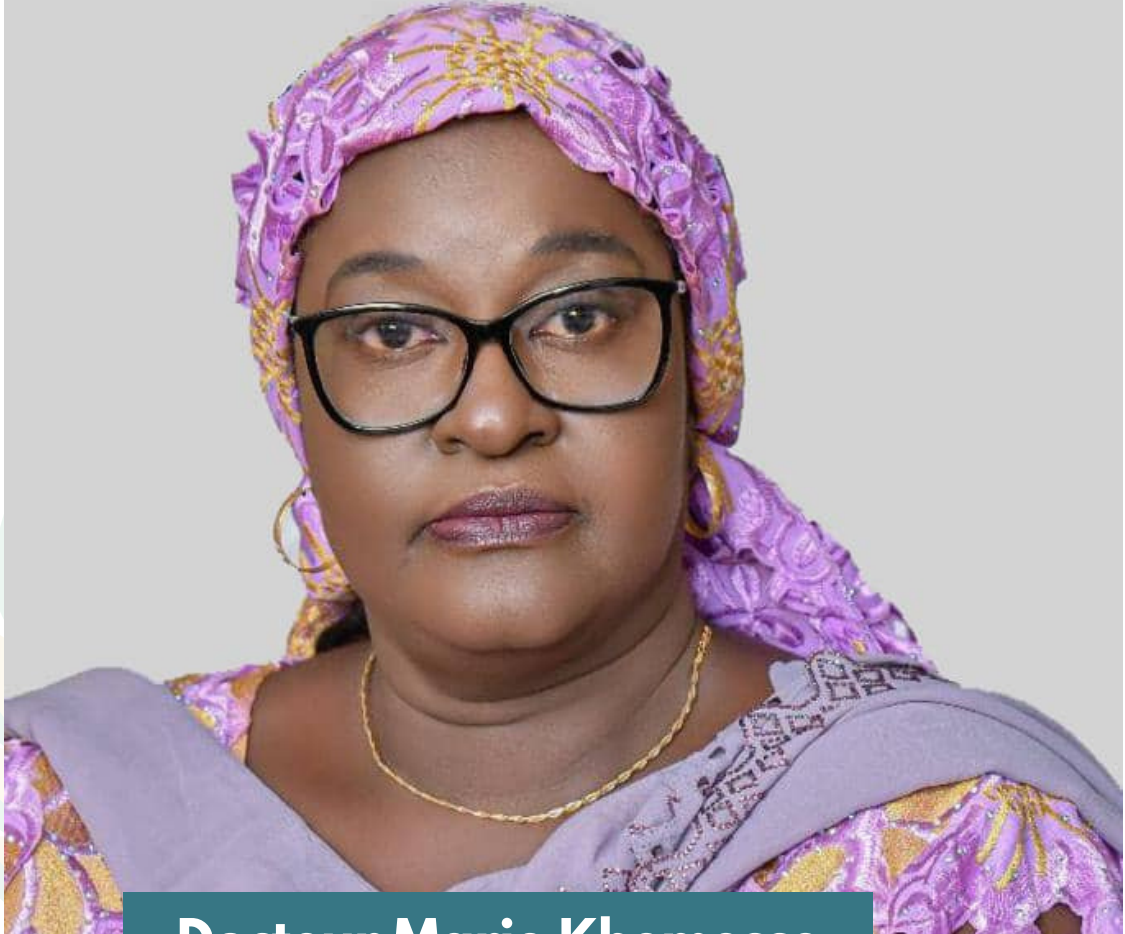
Docteur Marie Khemesse Ngom NDIAYE

Ministère de la Santé et de l'Action sociale ○ tutelle technique de l'Agence sénégalaise de ○ Réglementation pharmaceutique