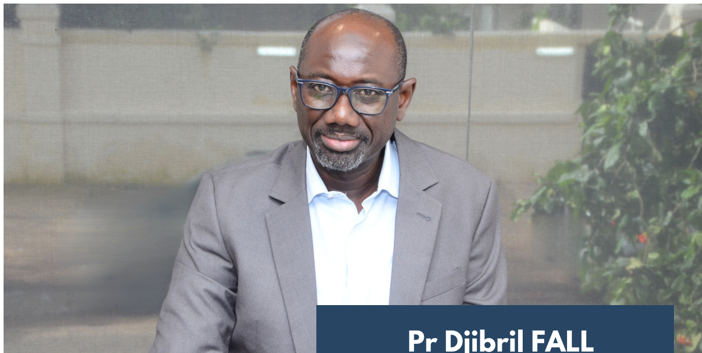
Pr Djibril FALL

« Le contrôle de la qualité des médicaments et produits de santé, une nécessité pour l'ARP ».