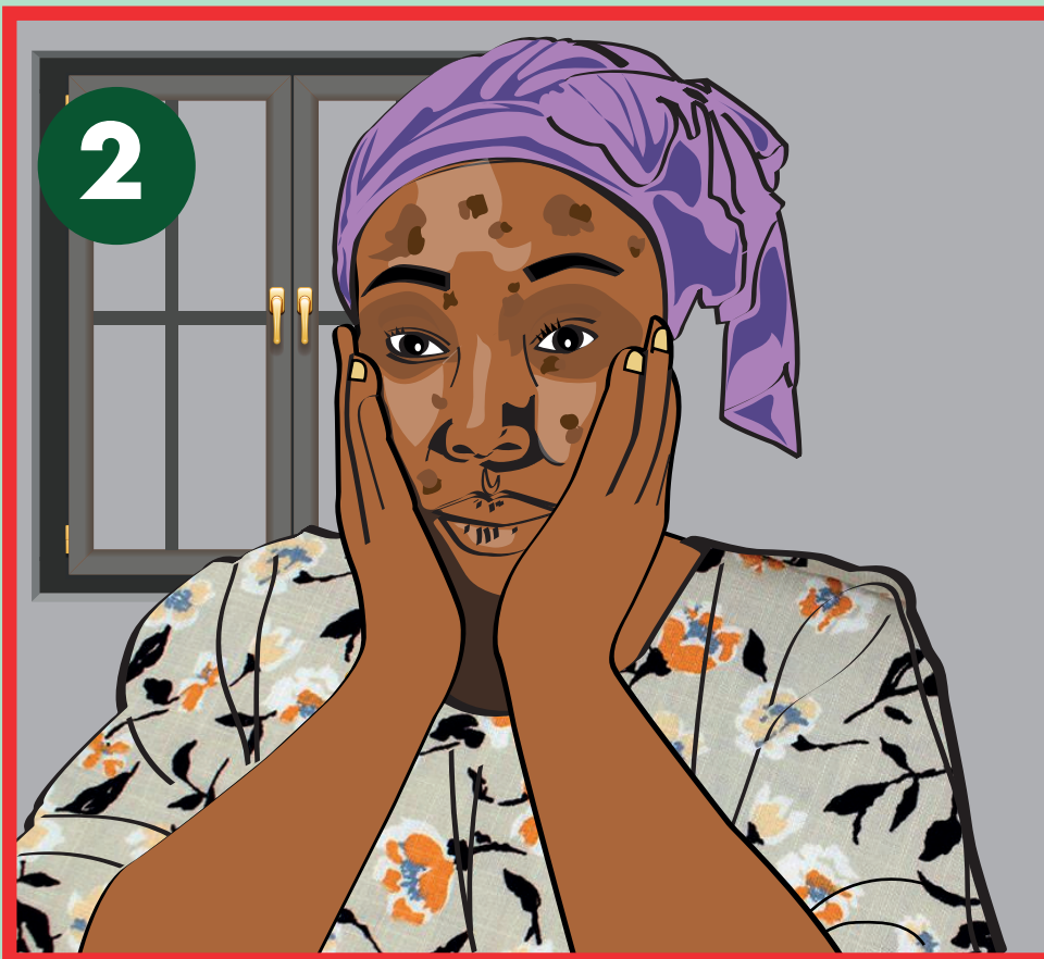
Apparition d'un effet indésirable sur le visage et sur le cou quelques temps après

Quelques exemples d'événements indésirables