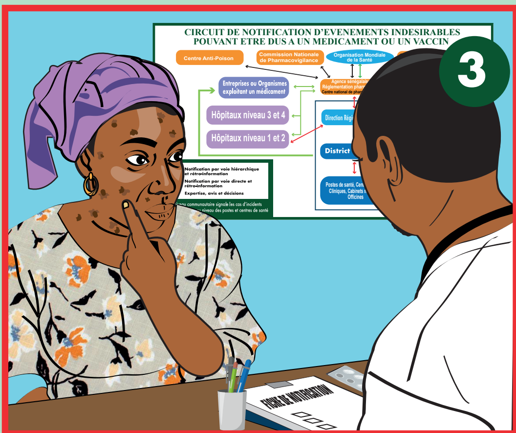
Elle se rend chez le professionnel de santé pour déclarer l'effet indésirable